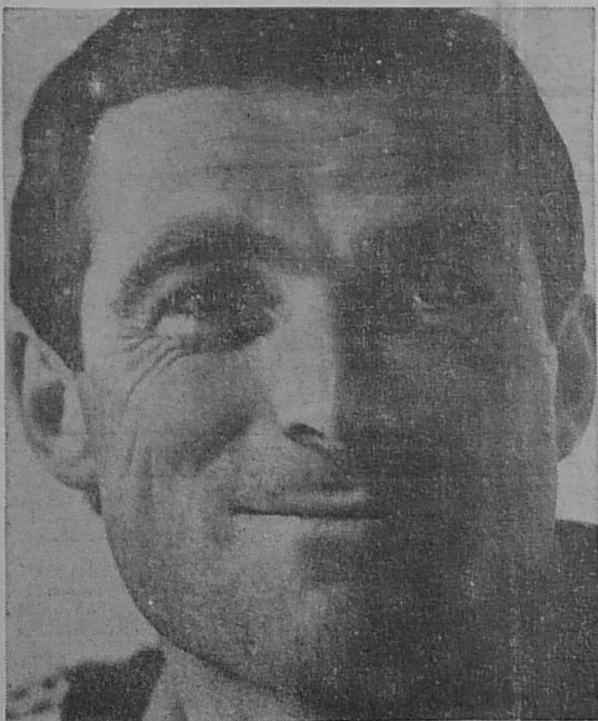
BERNARD HINAULT :

Un navigateur expérimenté, estimé de ses collègues, part pour la dernière course... et n'en revient pas. C'est la tragique loi de l'aventure, de l'exploit sportif, mais c'est cruel. (Voir page 6.)