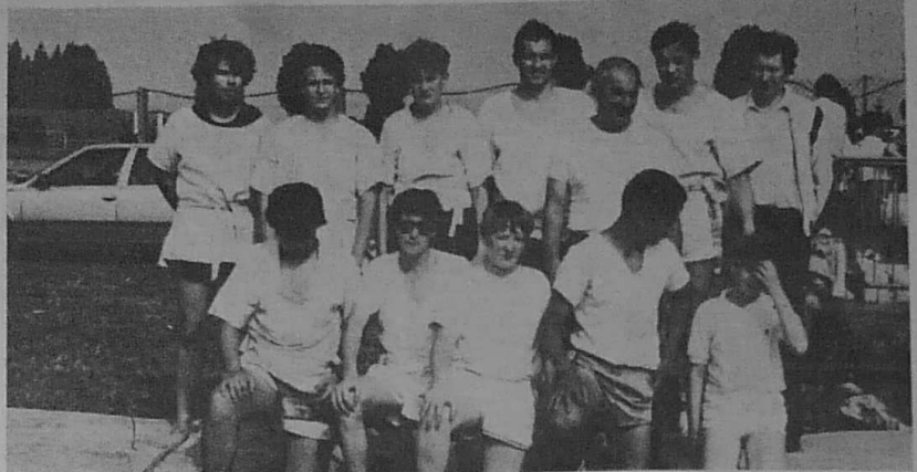
Le groupe de lutteurs.