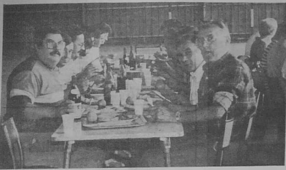
Une joyeuse table pendant le jeu.