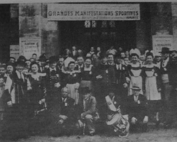
Le Premier Pardon de l'Après-Guerre à Saint-Denis, les 20 et 21 mai 1945, soit 12 jours après la capitulation allemande...