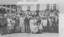
La Société des Amis du Pays Breton d'Argenteuil et du Val d'Oise avait prévu ce dimanche 22 ses amis pour un programme...