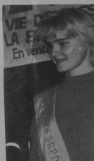
C'est devant un café bien chaud, agréable par cette