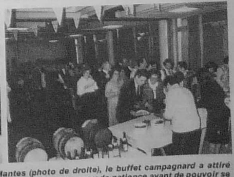
Sociétés Bretonnes. A Mantes (photo de droite), le buffet campagnard a attiré beaucoup de monde. A tel point qu'il faut un peu de patience avant de pouvoir se servir.