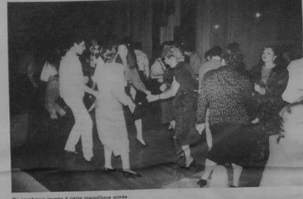
De nombreux jeunes à cette magnifique soirée.