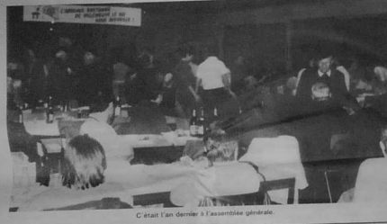
C'était un bon dîner à l'assemblée générale.