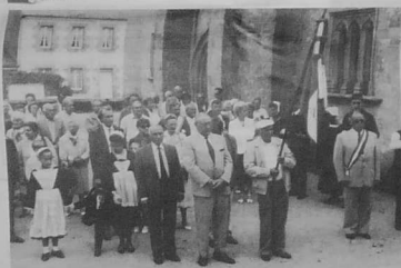
Hommage à la Résistance et à tous les anciens combattants morts pour l'indépendance de la France et la liberté en espérant un monde sans guerre.