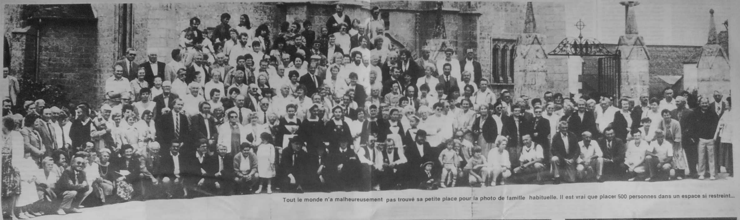
Tout le monde n'a malheureusement pas trouvé sa petite place pour la photo de famille habituelle. Il est vrai que placer 500 personnes dans un espace si restreint...