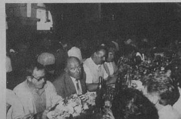
Une table bien garnie et des échanges multiples concernant la vie en Bretagne et en Ile-de-France.