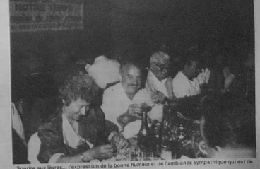
Sourire aux lèvres... l'expression de la bonne humeur et de l'ambiance sympathique qui est de rigueur en cette journée.