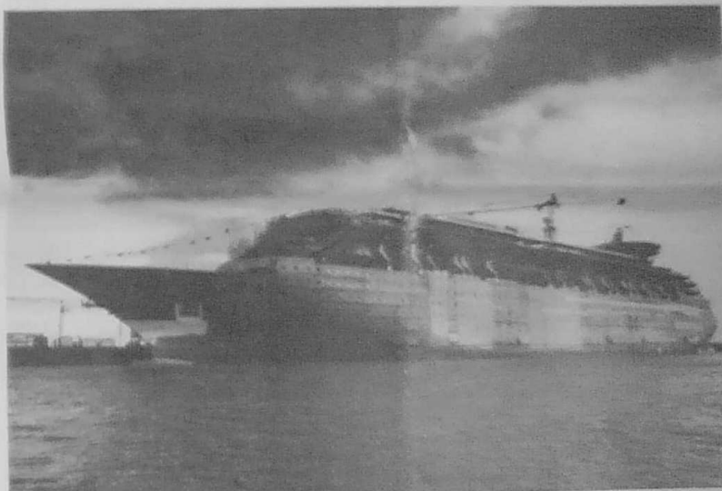
Le "Souverain des Mers" au quai à Saint-Nazaire, où il vient d'être mis à l'eau.