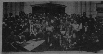
Une section F.T.P. ayant participé à la libération de Lannion, cinq jours avant l'arrivée des alliés.

Salle de la Légion d'Honneur - Ville de SAINT-DENIS (Face à la mairie et à la basilique. Métro Saint-Denis - Basilique).