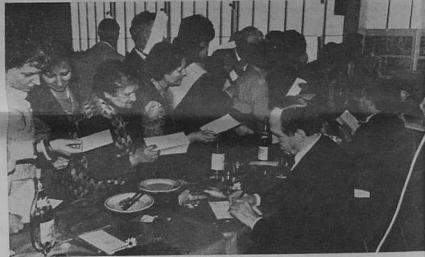
Messieurs les ministres s'il vous plaît...