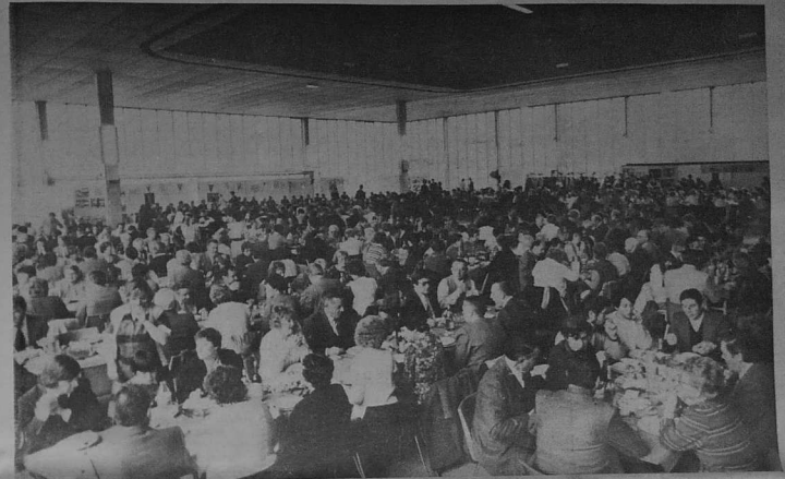
Une vue partielle de la foule à table dans l'immense salle de la Maison du Peuple.