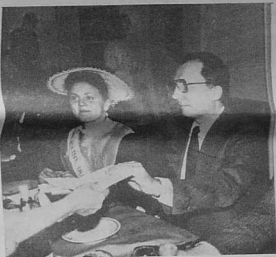
Dédicace du ministre et sourire de la Reine.