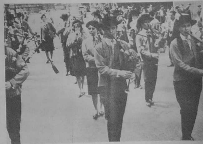
Célestien, le défilé au cours du Pardon de juin 1982. Cette année, le défilé se composera de huit groupes et bagades de la région parisienne. Plus de 250 costumes arboreront le dimanche matin les rues principales de Saint-Denis. L'après-midi, on les retrouvera sur la scène.