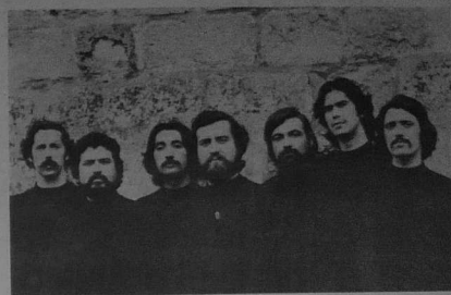
Le prestigieux groupe celtique LES QUILAPAYUN