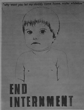
«Pourquoi ne voulez-vous pas laisser mon papa revenir à la maison ?»

Sincèrement, Republican P.O.W. Long Kesh