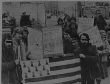
Une vue partielle du pickets devant Dublin Castle (28-11-79).

Au mois d'octobre 1979, s'est créé à Galway, en République d'Irlande, le «Breton Rights Committee of Ireland», (Comité Irlandais pour les Droits Bretons). A l'origine de ce comité, des JEUNES Bretons et Bretonnes installés dans la région de Galway et à Dublin. (D'instinct sur «jeunes» pour des raisons qui seront développées par la suite). Certains d'entre nous sont ici pour échapper à la justice politique ou militaire de l'Etat Français. Certains d'entre nous n'avaient jamais milité auparavant, d'autres ont travaillé avec Skol an Emisv, les C.A.B., le FASAB .... Ce qui nous a réunis tout d'abord, c'est notre condition commune de jeunes exilés Bretons en Irlande. Que nous soyons ici par choix ou par nécessité, nous avons cela en commun. Nous avons tous connu, ou connaissons, des difficultés d'adaptation et d'insertion dans la vie Irlandaise (langage, mentalité, boulot, logement...). Et surtout, nous avons tous en commun l'amour du peuple Breton et de notre terre-mère. Et c'est à la suite d'un long cheminement communautaire que nous avons décidé, avec la création de ce comité, de nous affirmer en tant que Bretons d'Irlande.