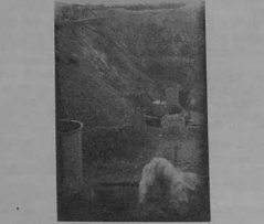
Mine d'uranium à Piriac (mars 1980)