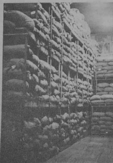
Pommes de terre en stock.

Assemblée générale des sympathisants et militants d'Argad Breton de la région parisienne - mercredi 30 avril - 33, rue des Vigotelles - Paris XXe (20 h 30).