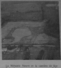
La Métairie Neuve et la carrière de Ker Roland.

garanties absolues contre tout risque de nuisances et de pollutions : «la COGEMA travaille proprement». Dans la réalité, le chantier de la Métairie Neuve a largement dépassé les deux ans (sous un) pendant lesquels les habitants du village de la Métairie Neuve, tout proche, ont dû supporter les nuisances les plus diverses : tirs d'explosifs, bruits d'engins, transports de matériaux, etc. Et aujourd'hui la mine est toujours ouverte ! malgré la convention, car, dit la COGEMA, il y a encore du minerai en profondeur et en d'autres lieux accessibles par galeries. Le site est donc plus riche que prévu, c'est ce qui explique l'insistance avec laquelle l'éternel chargé de relations s'est acharné, sans succès, à arracher à l'exploitant une nouvelle convention de mise à disposition, tandis que la COGEMA continuait l'exploitation au-delà de la date prévue. Combien de temps dureront les travaux ? Jusqu'où s'étendront les galeries ? Ou seront rejetées les eaux polluées ? — autant de questions posées par l'agriculture et que la COGEMA a laissées sans réponse, «nous ne le savons pas nous-mêmes» dit-elle, ne voulant sans doute pas révéler l'ampleur des travaux projetés.