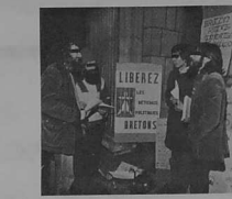
Quatre des cinq grévistes de la faim, devant le General Post Office, à Dublin (24-11-79).