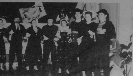
A l'assemblée générale de Clamart en décembre 1989.