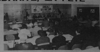
A l'assemblée générale de l'Amicale de la R.A.T.P., ambiance studieuse avant le filé.