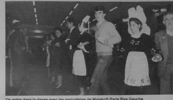
On entre dans la danse avec les amicalistes de Malakoff-Paris Rive Gauche.