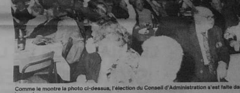
Comme le montre la photo ci-dessus, l'élection du Conseil d'Administration s'est faite dans la bonne humeur.