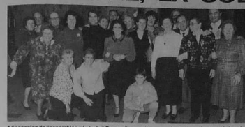
A l'occasion de l'assemblée générale à Bonneuil, un petit groupe s'est retrouvé autour de la présidente pour la photo-souvenir.