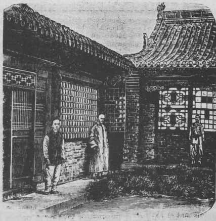
Chine : Prison des séminaristes et des sœurs du Chan-si septentrional (d'après une photographie).

Les neufs derniers jours s'accomplissent en palanquins portés par deux mulets. Chacun de ces "engins" porte deux personnes. Le relief, très accidenté, rend le parcours difficile : montée jusqu'à 2000 mètres, descente abrupte jusqu'à 900m, au bord de précipices de 60 à 80 pieds, traversées de