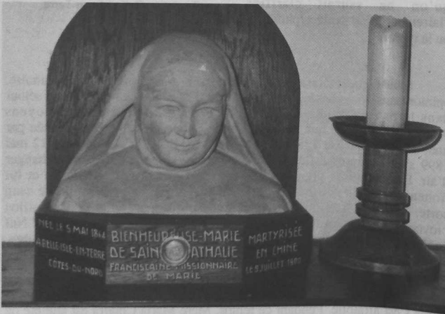
Buste de Sœur Marie de Ste Nathalie, vénérée en la sacristie de Belle-Ile en terre avec relique de son vêtement en médaillon.

Grâce à l'effort de tous, l'amélioration des installations accroît les possibilités de la mission jusqu'au moment où tout est remis en cause par les persécutions sanglantes, conséquences de la révolte des Boxers.