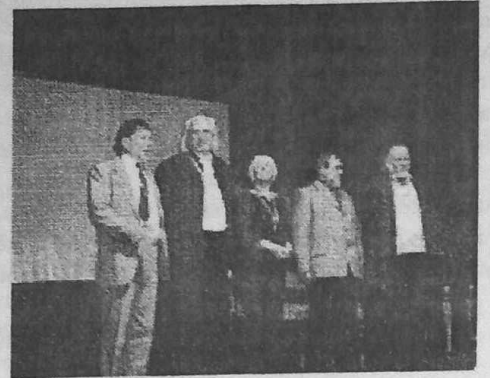
Les Herminés 2004