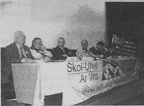
Châteaulin le 20 novembre 2004

Les recherches et réflexions de la section sur ce thème ont donné l'occasion de confronter, dans un échange particulièrement fructueux, les apports très riches d'intervenants de grande qualité :