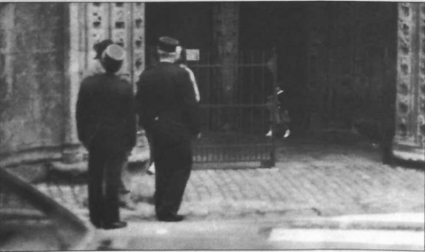
Daou archer o vont d'an ofrenn war ar abid archerien ? E-pelec'h emaoamp amañ ? Petra zo en em gavet ? Ar respantou (mad pe get) a vo embannet war b/Pobl Vreizh. Bec'h d'ar pluennoù !