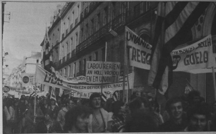
Ar gomz d'ar Vretoned, ha n'eo ket heñvel war ar ru, ur wech ar mare (evel amañ e Naoned), mes ingal : red e vo dezo tapoud krog e-barzh ar rod-stur, ha bezañ mestr en a bro, ewid gelloud bewañ eurus enni.