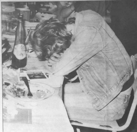
« Meur a zoare zo da dec'houd kuit... »

Ewid lakaod e hanw pe goulemñ titouroù all ouzhpenn skrivio da : Skol dre lizher Ar Falz Albert Deshayes, 15 Hent Bras Breizh 29000 Kemper.