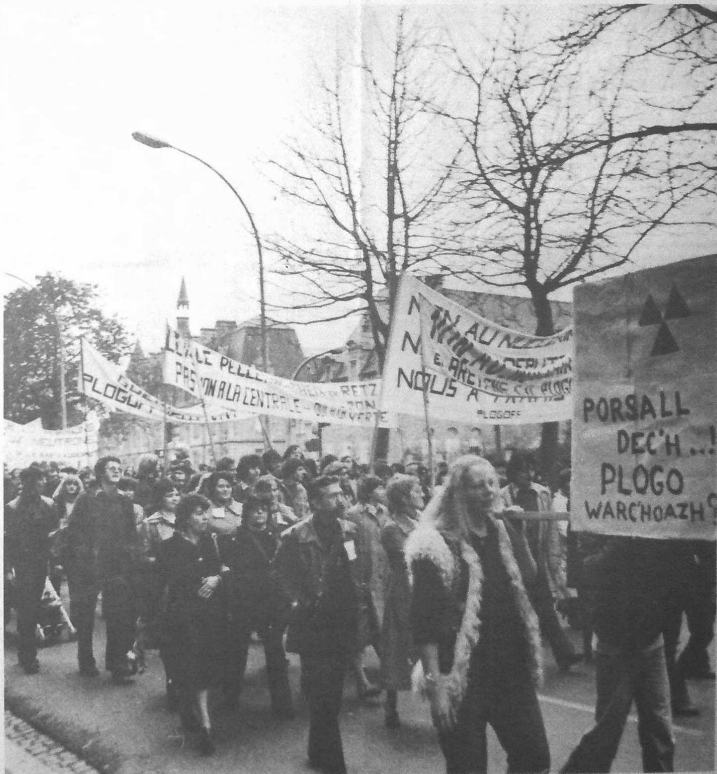
Pessort amzer da-zont ewid Breizh ?