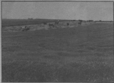
Penaos en em c'houdoriñ pa vez awel fall.

Ewid tud zo, n'eus netra vad da lavared diwar-benn an adlodennañ. Ewid lod all, n'eus netra gwelloc'h. Kredapl a-walc'h ema ar wirionez etre daou. Med neuse, petra a vez rebechet gant lod ? Kalz traoù, ewid doare. Da gentañ, dre ma 'z eo un dra reaz herwez al lesenn bet sovet e 1941. D'an eil, dre ma 'z eo un dra goustus ewid ar beizanted. Ouzhpenn-se, dre ma vez toalet re a gleuzioù d'an traoù gant ar mekanikoù ; ar pezh a laka, herwez lod, an amzer, an douar, an dour hag all da chañch a-grenn, hag a laka hon bro da zont da vezañ heñvel-mil douz ar Beauce, pa ne vez ket un deserzh sech divalaw epad an harv hag ul lenn bras epad ar gouviñ. Ur rebech all c'hoazh : garet e vez kement-se ewid kass ar beizanted kuit, ha tapout o douaroù diganto ; roet e vo ar re-mañ goude-se d'un nebeud labourerien-douar pinwidig, atantou bras deho dija, hag a va leo dorn-ouzh-dorn gant al labouradegoù hag ar c'hevredadoù-kenwerzh kapitalour. Ha daoust hag-efv ez eo gwir toud an traoù se ?