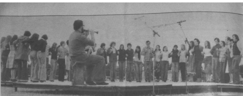
Amañ n'emaomp ket e-barzh ur gouel retro...