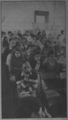
broudet ar skolaerien da gelenn brezhoneg.

Ewid amzer da zont ar strollad, e ro kendalc'het gant an hent bet kemet bloavezhioù zo, da lavared eo kenlabourad muioc'h mui gant an oll re a stourm ewid ar sosialism. Goulenn a raio AR FALZ mond e-barzh ar F.O.L., klaskañ a raio kaoud darempredoù gant an oll sindikadoù ha strolladoù eus an tu kleiz. Ouzhpenn-se e skozello AR FALZ stourm Skol an Emsav ewid ar cheknaoegoù e brezhoneg. Un nebeud mennadoù zo bet votet, en o zoues unan o c'houlenn ma vefe gzaet, gant an administrasion, bruderezh ewid kelennadurezh danvez Breizh e skolioù derez kentañ, hag iwe ma vefe