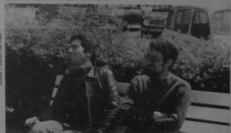
Setu amañ, bremañ, an deus un o-deus dilabour da serñf herzi

diskrog-debriñ : greve de laim ; ragrison : détention préventive.