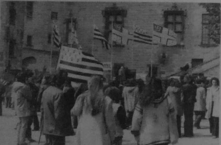
Klasked Pobl Vreizh

E-barzh ma c'hoz douar bras, e vez din ur bigadur mas o ressew beb mod «Pobl Vreizh» hag o kavoud emae an tamm kalonikel deus e spered. Ya, m'eus ressewet niverenn a vis Ebrel «Pobl Vreizh», un deiz goude bezañ kaset deoc'h va d'her an 8. M'eus ket keuz diouzhtu bezañ kaset anezhañ, med bremañ ne m'eus mui... Goulenz a ran deoc'h da dremen heb bezañ distruet ouzhoñ abalamour da'm fasioù : n'eo ket c'hoazh di-ze ma brezhoneg, med ne gollan ket kalon : ar c'hozhoù an henn eo kentezoc'h. Claude RILLY Blots