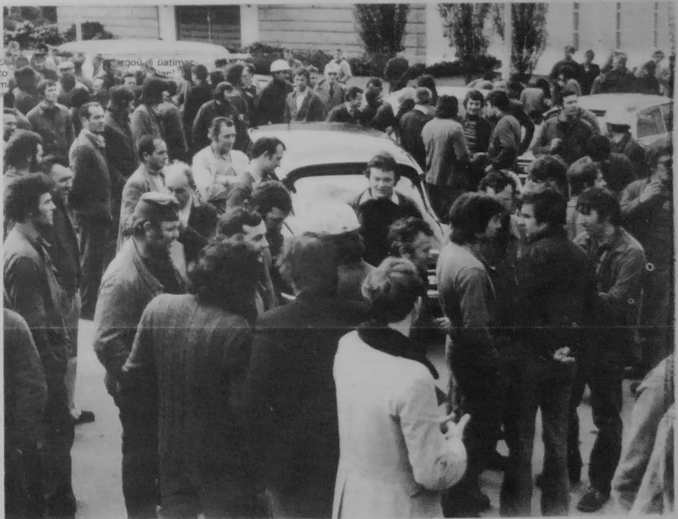
Micherourien an A.F.O. o vanifestiñ dirag ar PAC, d'an 19 a vis Mae