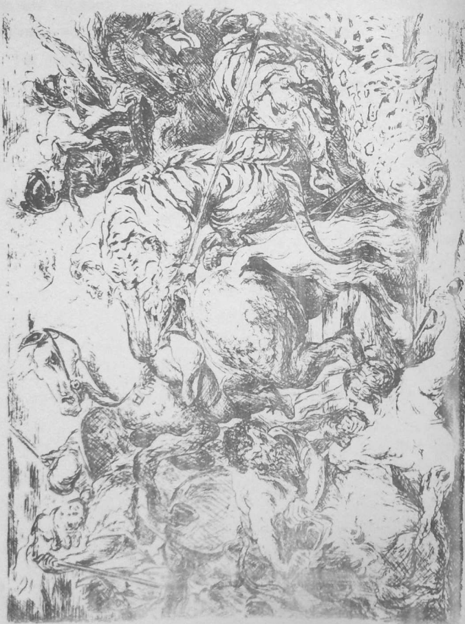
O hemolc'hin leoned ha tigred