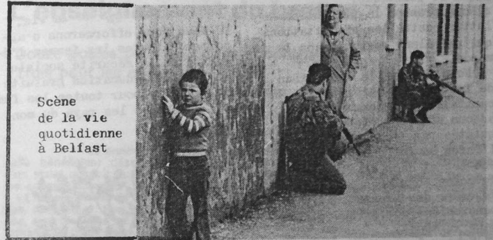
Scène de la vie quotidienne à Belfast

tion économique). L'histoire ancienne et récente, et les données géographiques montrent clairement la nécessité d'un rétablissement d'une indépendance économique vis-à-vis de la France.