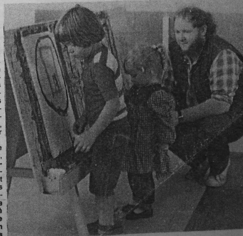
Plaisirs de la peinture, avec les encouragements, en breton, de l'instituteur.

Diwan n'a disposé en 1981 que de 16 % de subventions (locales, départementales ou régionales), pour un budget qui dépassera 3.000.000 de francs en 1982.