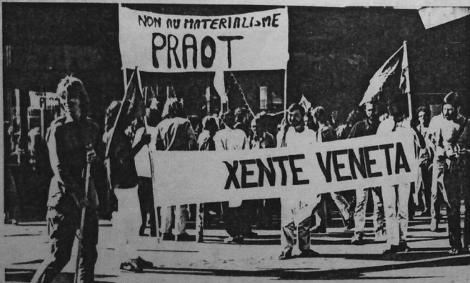
Au départ de la manifestation organisée à Rennes

"Dans l'intérêt de la langue française, la langue bretonne doit disparaître." (un ministre français)