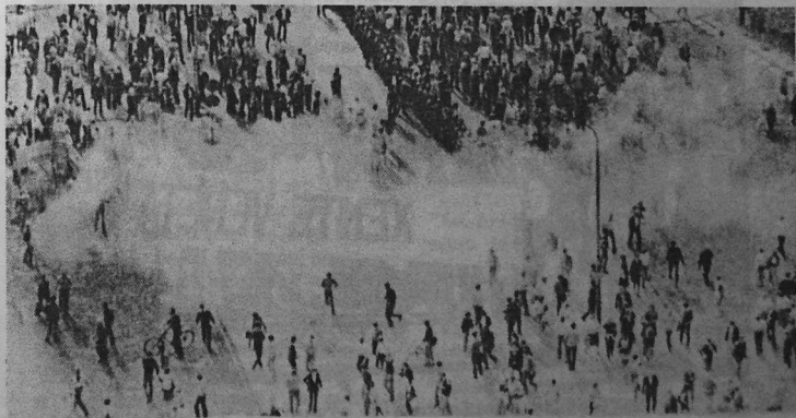
Les récentes émeutes en Pologne

L'Europe de l'Est est en train de vivre une crise idéologique. Malgré toutes les mesures policières le syndicat Solidarité continue d'exister et d'agir. Il y a rejet en masse de l'idéologie marxiste et de la tyrannie stalinienne et cela non seulement en Pologne, mais, comme l'indique de nombreux indices, dans l'ensemble des pays de l'Est où les problèmes économiques et sociaux sont loin d'être réglés.