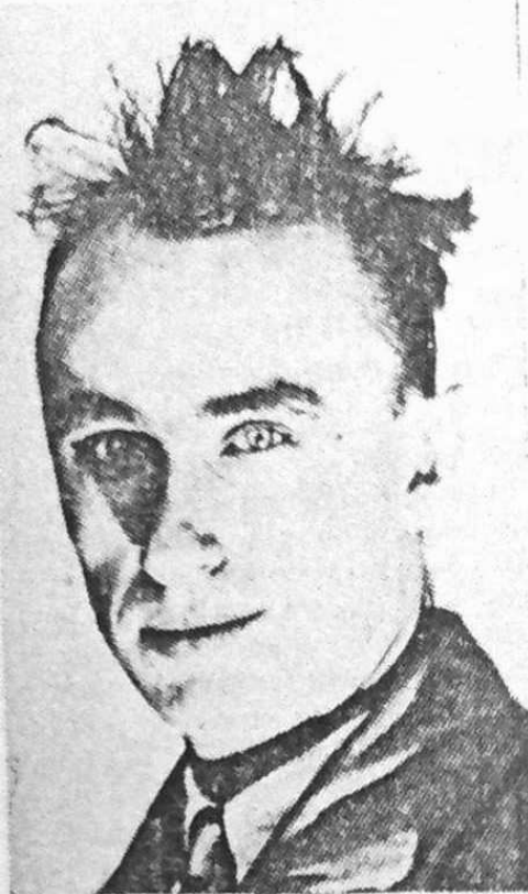
Portrait de Tanguy par Man Ray

Autant que Masson et Duchamp, Tanguy aura influencé la jeune peinture américaine. Il est le créateur d'une des branches nourricière du surréalisme : cet « onirisme » que Dalí saura exploiter avec le tintamarre que l'on sait. Mais le peintre de Locronan n'a que faire de la gloire, lui qui n'est que « le guide des temps des druides du gul », comme le dénommera pertinemment un de ses amis. A la recherche de son Ys spatiale, des silences tourmentés et des grèves désertiques, de tout un monde marin, sous-marin, mena-