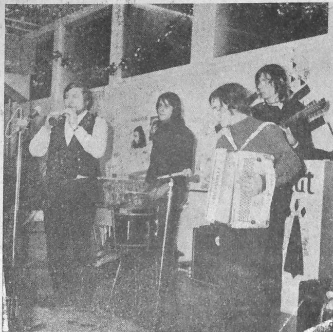
Lazhet an tele : festoù-noz adarre ?

Koulskoude, « brokusoc'h » eo bet an ORTF ouzh ar Vretoned eget ouzh or pep brasañ eus pobloù all ar Frans. Hervez sifroù embannet gant « Le Monde », diwar 9 eurvezh 26 munutenn e yezhoù « rannvroel » er radio bep sizhun, ez eus 2 eur hanter e brezhoneg : muioc'h hon eus eget Okitaniz (1 eurvezh 56) a zo 5 gwech niverusoc'h egedomp. Korsiz no deuz nemet ur c'hard eur, ha Katalaniz tri c'hard eur. Ar maout a ya gant Alzasiz (3 eurvezh) : 2 anezho a zo divyezhek avat, ha ret eo lavarout ouzhpenn e vez selaouet abadennoù skinwel an Alamagn gant