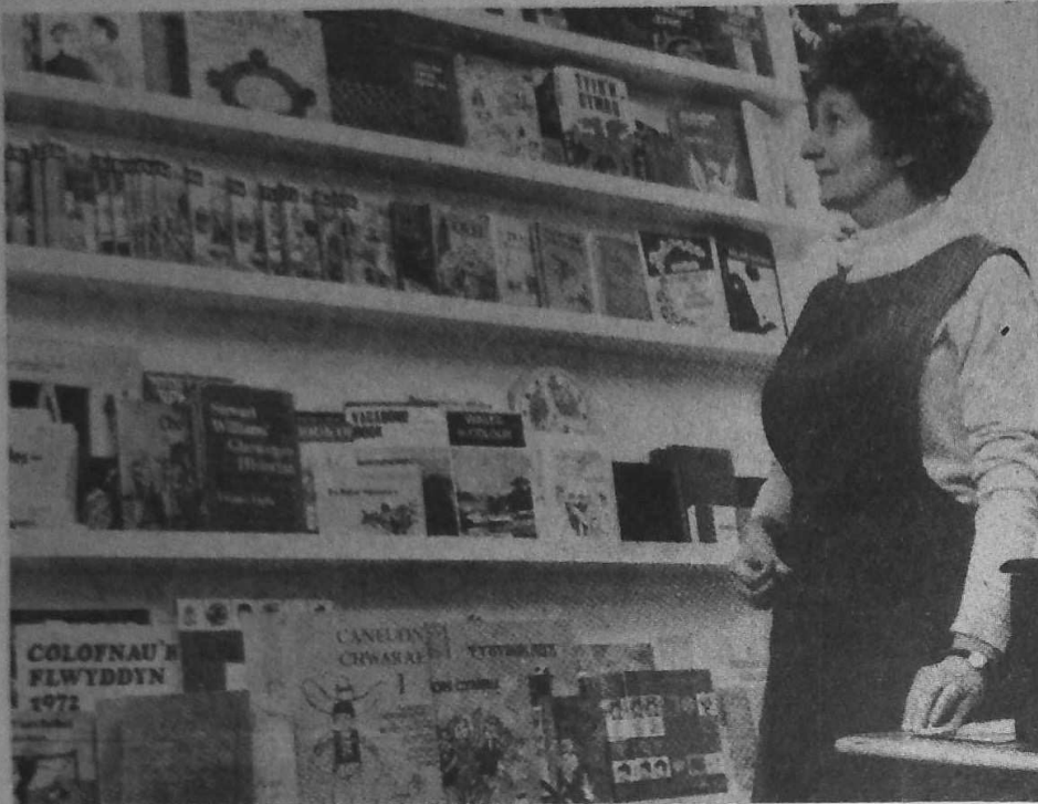
Kembre : un hanter milion a lennerien ?