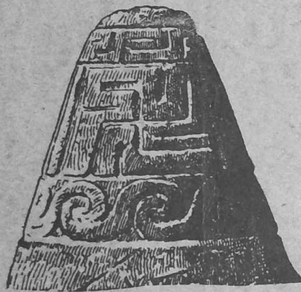
MAEN-KREIZ BRITTIA Omphalos de Bretagne (Kermaria)