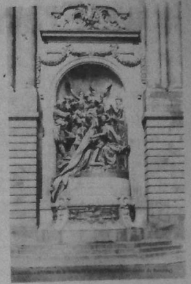
7 août 1932

Huit août 1982 : les républicains bretons qui ont pris le flambeau de la lutte pour l'indépendance nationale fêteront le 50 e anniversaire de cet acte qui a fait connaître au monde entier l'existence d'une Bretagne invaincue.