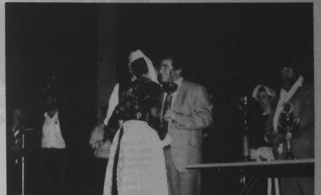
Remise des prix par M. le Conseiller Général, Maire de Quéven

4 e , Pontivy avec 14,61 5 e , Rostrenen avec 14,05 6 e , St-Alban avec 13,48 7 e , Plomelin avec 13,39 8 e , Pluneret avec 13,26.