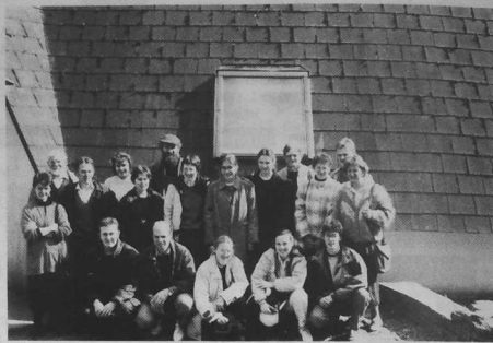
Les moniteurs 1 er degré

Le petit nombre de stagiaires a permis un contact plus chaleureux entre tous les concernés. De plus, la neige ayant perturbé le déroulement prévu, les stagiaires ont eu le loisir de se