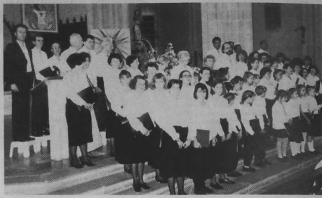
La "Chorale des Marsauderies", sans changer de structure, a cependant laissé le nom de son quartier d'origine. Elle s'appelle maintenant : Ensemble vocale DO.MI. NANTES et comprend 70 choristes.

Le rassemblement de chorales organisé par le ville de Guérande durant trois années donne l'occasion aux choristes de travailler une œuvre et de l'interpréter dans un grand ensemble de chanteurs et musiciens.