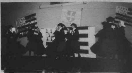
Bro Gwenn Rann