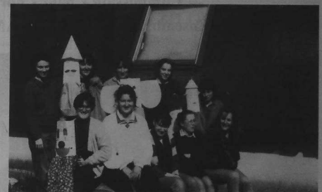
Formation Enfants 1 er niveau

On se rend compte que la demande est extrêmement diversifiée et les attentes encore davantage. Faut-il continuer à centraliser ce type de stages, même s'ils sont réalisés dans les amicales ? Une solution plus adéquate serait d'aider la programmation des amicales en ce domaine et de trouver les intervenants correspondants.