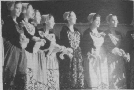
Festival de la Saint-Loup : danseuses du Cercle de Pontivy