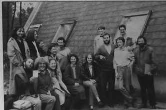
Le groupe de stagiaires de 2ème degré à Ti-Kendal'ch

Morlaix, Ploudiry, Châteaulin, Quimper, Carhaix, Spézet,