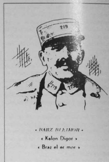
• JARZ BLEIMOR • • Kalon Digor • • Brez el er mor •

Tér léù ér méz taloet, tér léù doh en douar braz Me énézenn é saù, du é kevér er mor glaz; En herreg astennet tro-ha-tro hi goarn kléz Doh en houllenné goul' érag é ruill dé ha noz. ... Me halon zo duzé, én é négei peur E gieu' mesk o herreg, heb santéz er Celtaid.