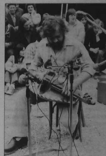
du morceau musical en fonction des instruments présents.

Il est enfin question d'orchestration, de "mettre en place" le déroulement