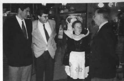
Vernissage Euromarché à Brest par M. le Maire de Brest

■ Puis, elle ira à nouveau vers Brest, Dijon, Oloron Ste Marie, Vannes, Paris.