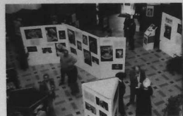
L'expo à Lorient...

"Le Conseil Régional ne s'intéresse pas seulement à son patrimoine architectural et vocal. En Bretagne, un pays était aussi la danse, le costume soulignera Monsieur Le Treut, disant tout le bien qu'il pense des initiatives de Kendalch pour la mémoire collective.