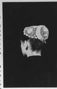
Sous-coiffe de Pontivy

Enfin, la Culture au supermarché puisqu'avec l'aide d'Euromarché Brest, nous avons pu présenter cette expo un mois et demi au centre commercial de l'Iroise.