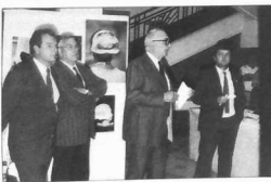
Allocution de M. Laudren au Vernissage de Lorient

Cette exposition a fait ensuite un tour-Breizh: