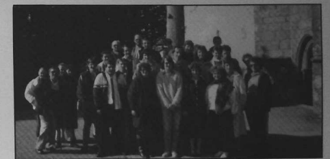
Les responsables de l'amicale et des groupes adhérents à l'occasion de l'assemblée générale du 12 octobre 87.

L'amicale Kendalc'h, créée en avril 1985, est heureuse du nombre de participants d'autant plus que 3 groupes participeront au concours de 1ère catégorie à Morlaix (Rostrenen, Spézet, Kerfeunten).