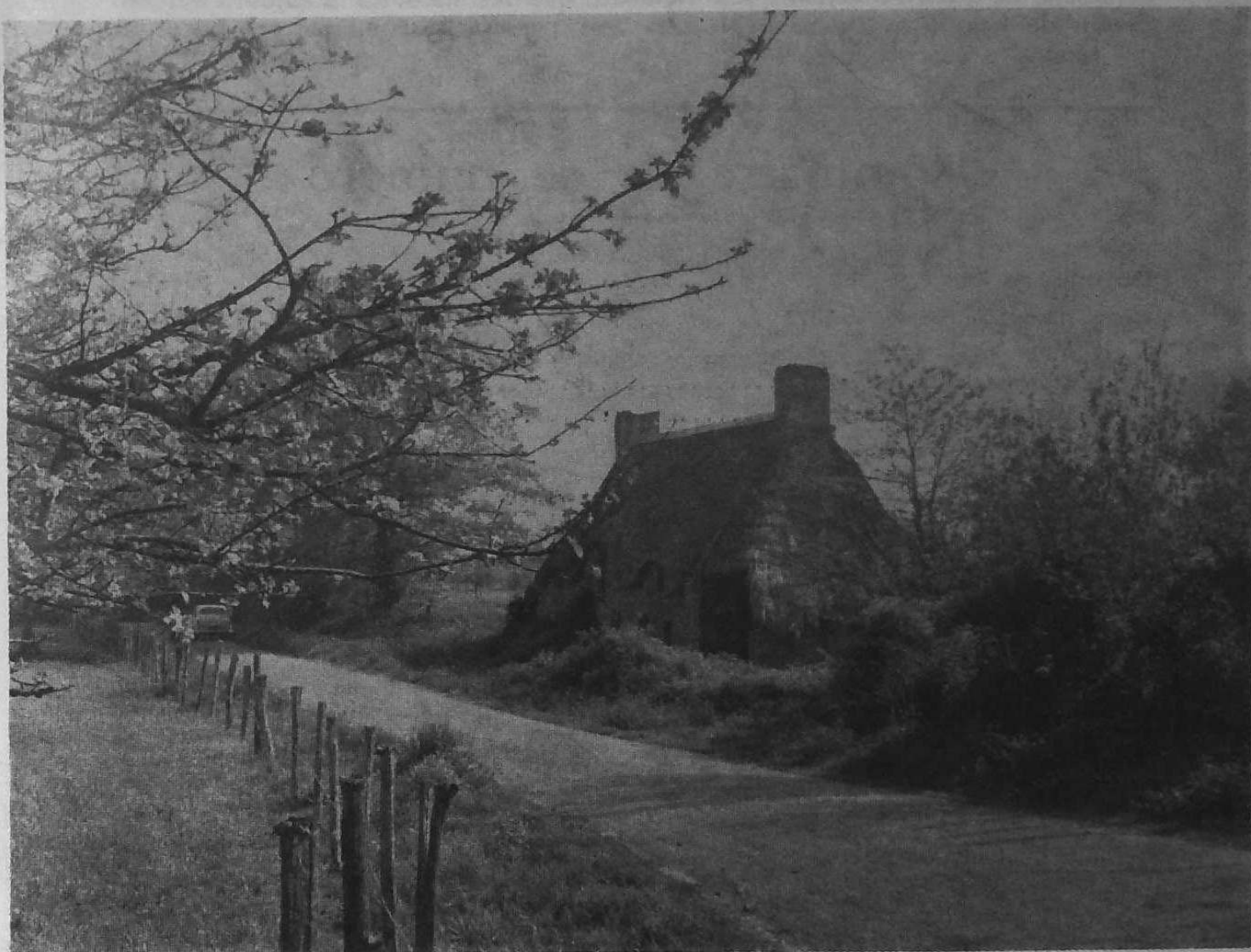
Ferme en Pluvigner