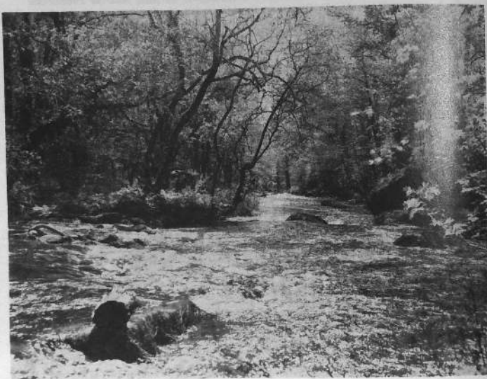
PONT-CALLECK. — Le Scorff

d) Enfin, un crédit de 50.000 F nous a été accordé par la D.A.T.A.R. pour l'acquisition d'un site nécessaire à l'implantation d'un laboratoire salmonicole que nous envisageons de créer sur un affluent du Blavet.