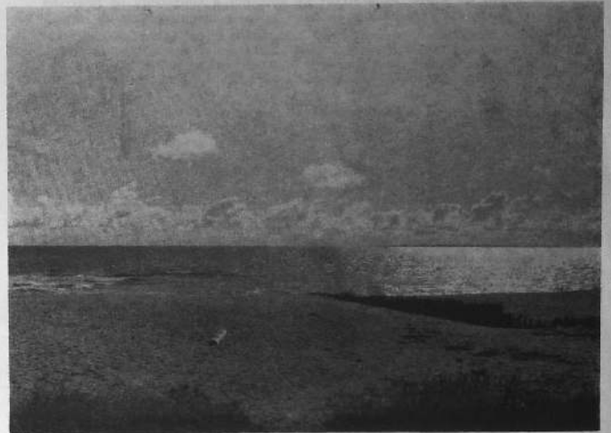
Dunes du Fort-Bloqué

Reportons-nous seulement aux études de M. BONNIN de la SEPNB sur la protection des dunes parues dans les cahiers de l'UMIVEM de février 1971 : « En ce qui concerne le Morbihan deux zones présentent des cordons dunaires, la première du Bas-Pouldu au Fort-Bloqué, etc... » et plus loin « bien que dé-