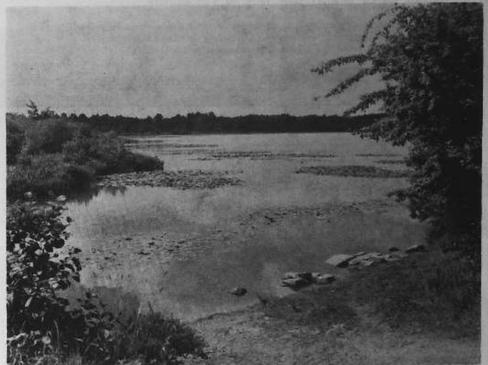
Etang de Kervignac - Brandérian, Coët-Rivas

— pour la conchyliculture : ce n'est pas par hasard que les centres ostréicoles sont situés dans les secteurs de Pénerf, d'Étel, du Golfe du Morbihan ; le marais sert de réservoir de nourriture : matière organique dissoute, éléments minéraux catalyseurs de croissance pour les algues microscopiques dont se nourrissent les huîtres ;