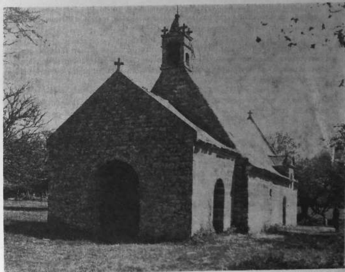
Sainte-Apolline de Tréfléan