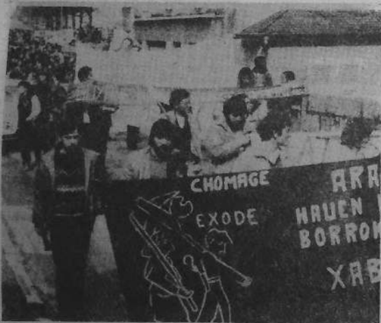
(Maule, d'ar Sul 4 a viz Ebrel)

A r gerioù-se a c'halled lenn un tamm pep lec'h, war vegerioù kêrbenn (vihan) Zuberou, a veze lidet enni, da Sul Fask, an Aberri Eguna, Devezh ar Vro, dindan ar glav bras.