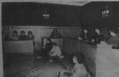
Micherourien HB Henriot o telc'her al Lez-vern-Koñvers