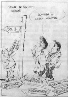
kartennoù-post gwerzhet gant S.A.E.