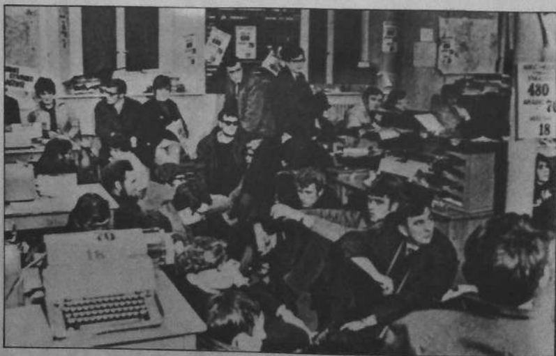
Studio ar B.B.C. aloubet gant ar C'hembreiz d'ar mars-se oa 480 eurvezh saozneg, 18 eurvezh kembraeg...