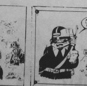
goullennit kartennoù-post Skol An Emsav 2,50 unan (10 lur ar 5)