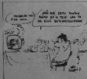
kartenn-bost gwerzhet gant SAE

Loeiz Bihannic - 65, straed Riancourt- 35400 Sant Malo-