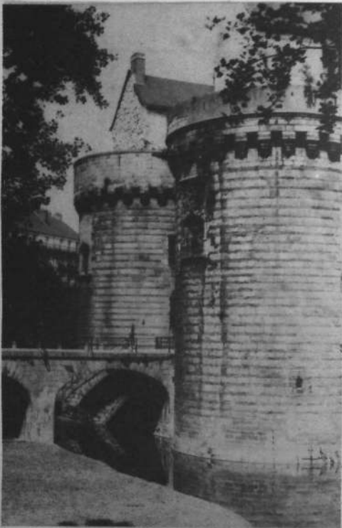
NAONED : Kastell an Duged An touriù-se a zo eus ar XV vet kantved