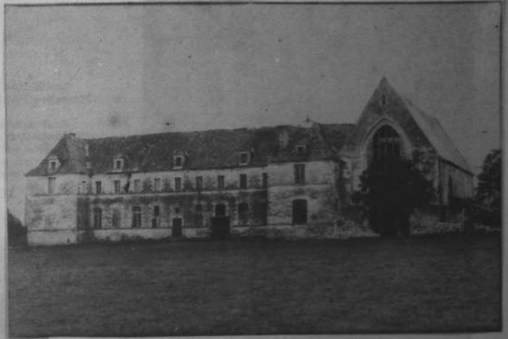
Abati « Blanche Couronne » (gwechall gozh « Koed Gwenn ») e-kichen Savenneg a Bro-Naoned.

E kêr an Naoned e vo aozet Diskouezadeg an Tresadennoù (diwar ar gelaouenn Presse-Océan , 29-9-75).