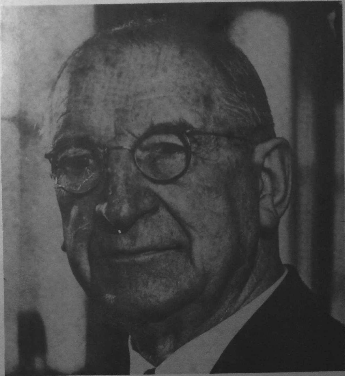
Eamonn de Valera (1882-1975)