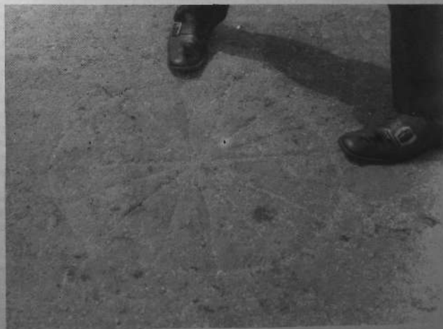
SKEUDENN SKULTET AN HEOL HAG AL LOAR