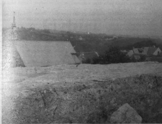
CHAPEL AR YEODED HAG AR MAEN-PLAT

Gant ar min plat , diaester ebet : kavet eo ar poell, n'eus mui d'ober nemet dibunañ ar c'helad rouestlet evit pezh a sell ouzh Istor ar Yeoded hag Istor Plourec'h. Pe mar kavit gwell, setu kavet ur stern hag aes klenkañ emañ an darvoudoù pennañ en em gavet gant Yeodediz ha Plourec'hiz a-hed ar c'hantvedoù :