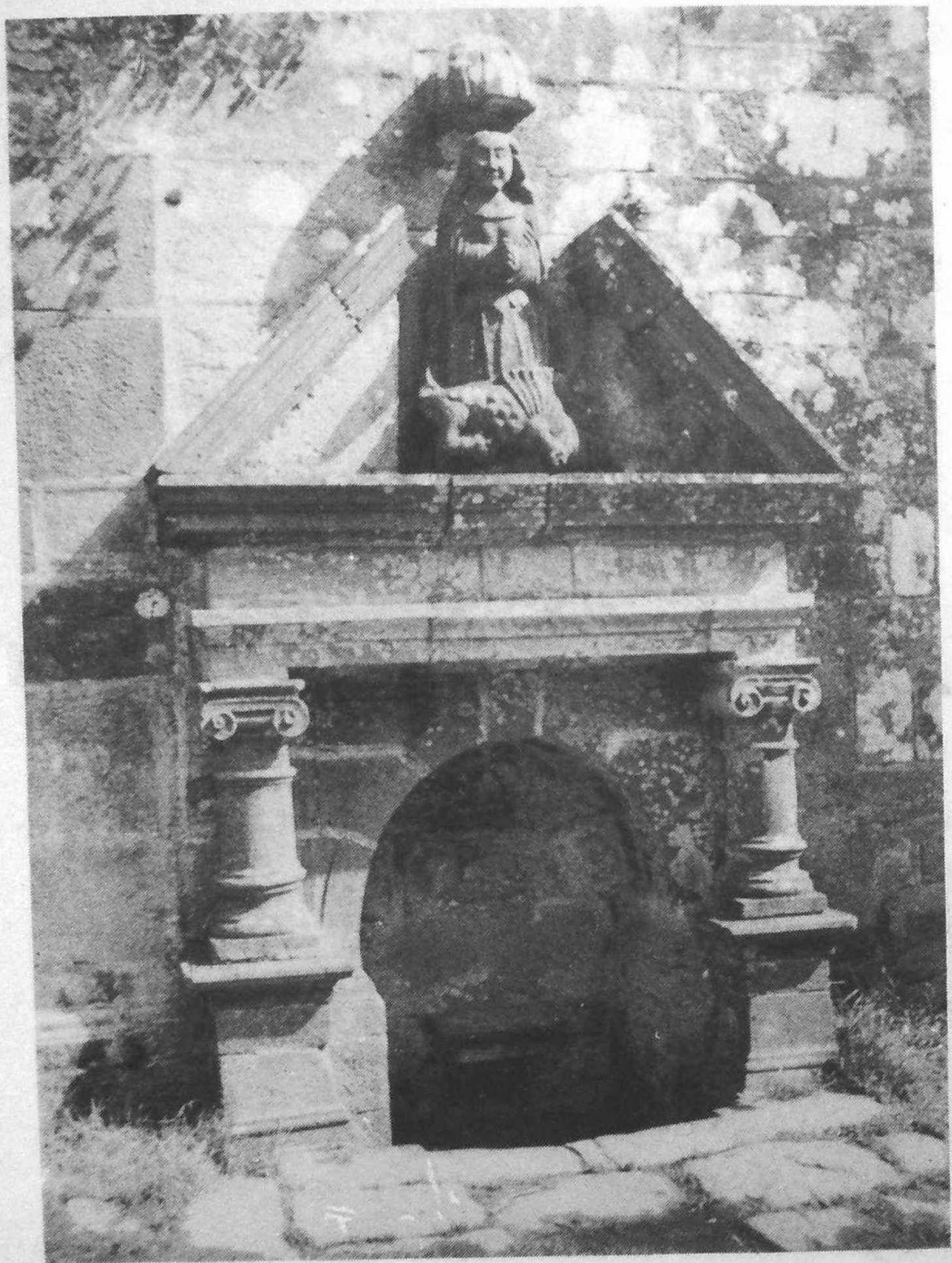
Feunteun Santez Marc'harid. Logonna - Daoulaz