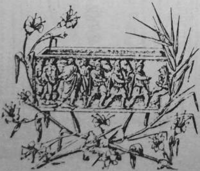
Kelc'h kristen eus ar c'hontadour kentan a gunkle gwechull ralsal prestital Sant-Erwan-ar-Brezhoneg

kontañ da ezhommoù ar barrez-se ha gouestlañ a raent a-wechoù hogos an div drederenn eus o dispignoù bloaziek da ober war he zro.