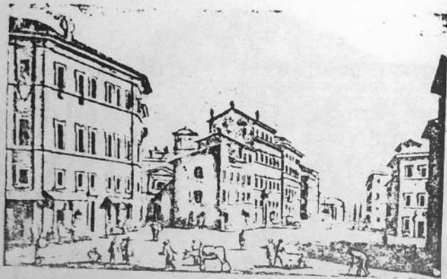
Iliz, prestital hag herberc'htl Sant-Erwan ar Brezhoned en XIXvet kantved