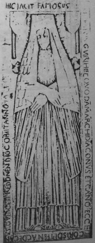
bezet bremañ e kloastr Sant-Loeiz-ar-C'hallaoued