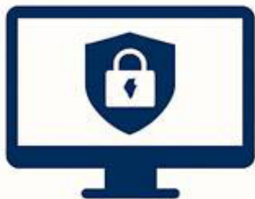
European Cyber Force (CYBEUR)