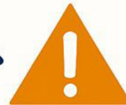
European Doctrine of Graduated Response