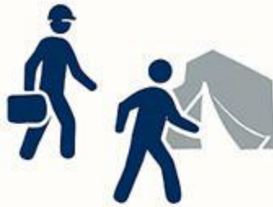
European Stabilization Corps (FORSECUE)