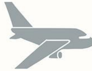
European Military Transport Fleet