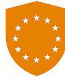
Eastern European Shield