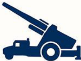
Common Strike Capability