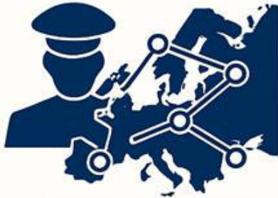
Integrated Command (COREUCOM)