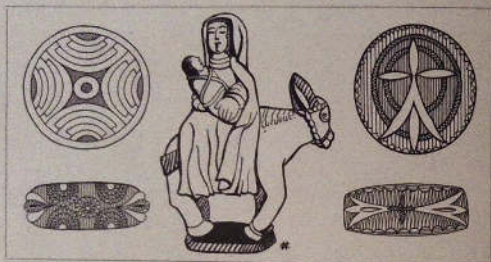
Meilleures formes d'origine auto-bretonne extraites des commentaires de l'Anthologie de Coiffes et Types actuels du Peuple Breton, appliquées à ses origines ethniques, par le prince Bianchi de Médici, dessinées de Noëlle Couillaud.