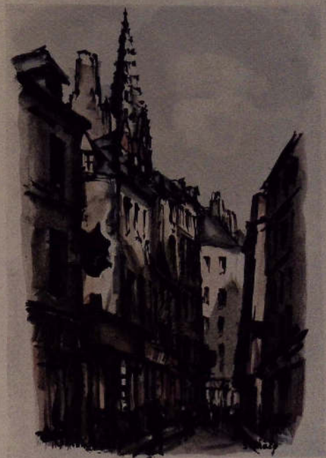
Reproduction réduite (le format est 28 X 48) d'une des planches lithographiques rehaussées de touches en couleur de J.-C. Contel.