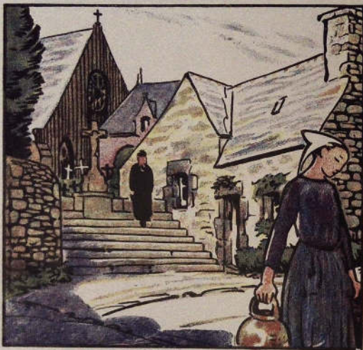
Dessin aquarellé de Malo Renault, pour D'Un Vieux Monde .