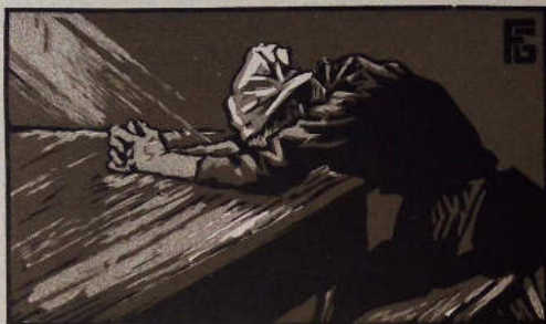
Reproduction d'un bandeau et d'une lettre-tête de Geo Fournier, pour Le Crucifié de Keraliès .