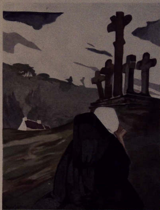
FAC-SIMILE grandeur nature, d'une des planches aquarelles de Louis Garin pour Tryphina Keranglaz .