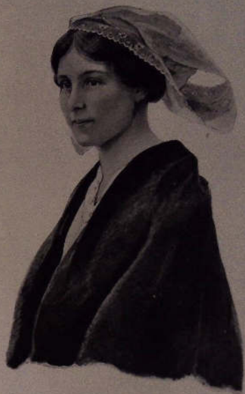
Traçants d'une des Coiffes dessinées par Noëlle Couillaud, commandées par le Prince Bianchi de Médici.

en Exemplaires sur Japon, numérotés de 1 à 10, de l'édition originale de l'artiste, égaux à ceux qui figurent dans les volumes de l'ouvrage. . . . . 800,00 450 Exemplaires sur Vellin, numérotés de 11 à 150 (c'est-à-dire sans quarante de volumes) . . . . . 300,00 20 Exemplaires hors commerce.