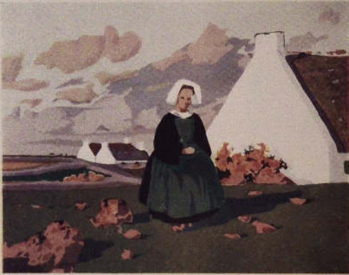
Aquarelle intitulée : La petite Aliénora de E. Guérin.

Six Aquarelles Bretonnes (signatures autographes des Artistes) J.-Ch. CONTEL..... Place à Guimard..... Léon HAMONNET..... Le Cap Fihel. Louis GARIN..... Ste-Sève le Palud..... G. de LAUNAY..... Choua. Ernest GUÉRIN..... Petite Aliénora..... Ch. MENNÉRET..... Logivy. Tirage à 500 exemplaires..... 70 fr. la pochette de 6 aquarelles. Au Pays Breton par Geo FOURRIER 1. Trouen. 2. Notre-Dame de la Jole. 3. Kethyl Saint-Pierre. 4. La Tomate. Héloïse sur Madagascar, numéros de 1 à 65, signature de Tartate (il reste encore une dizaine de séries)..... 40 fr. les quatre Les plus beaux Clochers de Bretagne, 8 reproductions d'art de Commanoud, sur papier glacé monté sur Modernes : Quimper, Dinan, Ploubalay, Vannes, Guingamp, Lorient, le site de St..... 25 fr.