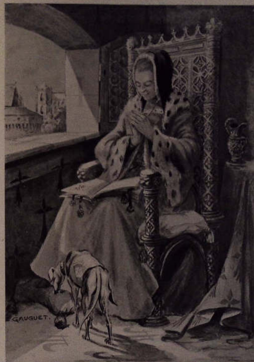
Reproduction, simili-gravure, l'une des planches hors texte d'Eugène Gauguet pour la Reine Anne de Le Guyader.