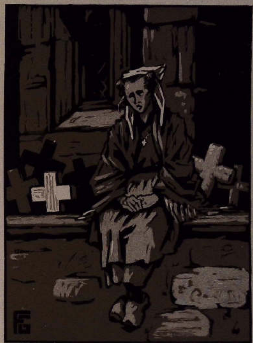
Reproduction d'une des huit planches hors texte de Geo Fournier pour Le Crucifié de Keraliès .

3 Exemplaires Japon ancien, avec suites en suite et contenant chacun un titre des originaux de Géo FOURRIER (éprouvé)..... 1.500,00 25 Exemplaires Japon impérial avec suites en noir numérotés de 1 à 25..... 800,00 3 Exemplaires Japon impérial avec suites en noir hors commerce..... 250,00 170 Exemplaires sur Rives de Millas numérotés de 26 à 200..... 250,00 25 Exemplaires sur Rives, hors commerce, numérotés de IV à XXVIII. Il a été en outre tiré à part 20 suites des illustrations en deux tons sur Japon impérial et 25 suites sur Chine de 26 à 50 francs (éprouvés).