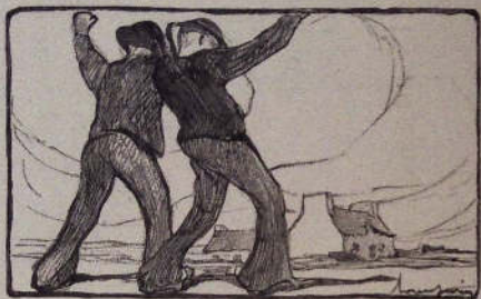
Banquet de Louis Garin, gravé sur bois par Soulas pour la Chanson de Cidre.