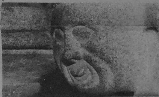
Une sculpture des fonts baptismaux : elle paraît très moderne dans sa schématisation. De grosses rides creusent les joues rebondies autour d'un large sourire.