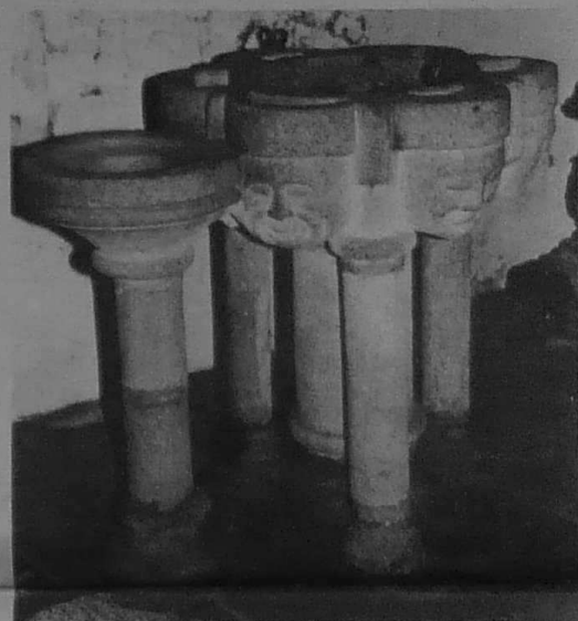
De quand datent les fonts baptismaux ? Peut-être seulement de la reconstruction de l'église au siècle dernier. Peut-être sont-ils aussi anciens que ceux de Brélévéné ; ils portent les traces d'un badigeon blanc dont ils ont été enduits à une époque indéterminée.

Voyons maintenant l'autel de N.D. de Grâces, dont le pardon a supplanté la fête des saints Pierre et Paul à qui est dédiée l'église. Il est visiblement plus soigné que l'autel latéral. On y a versé a profusion fines colonnettes, fleurons et clochetons ciselés. L'œuvre est signée « Le Merrer père et fils, sculpteurs, 1871 ». Ce sont ces célèbres ébénistes lannionnais qui ont exécuté toutes les boiseries du chœur, comme en maintes églises de la région. Le marche pied de