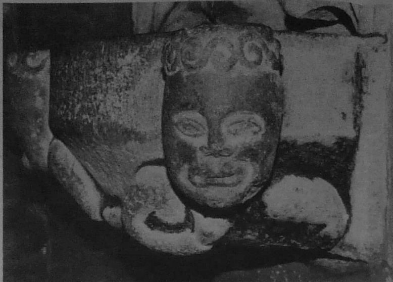
Une des deux têtes du bénitier encadré dans le mur : elle présente un visage plus fin et plus agréable que l'autre. L'artiste avait deux modèles ou a su distinguer des types humains différents.