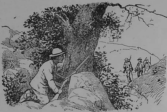
P'en em gavis eun devez dirak tri zen ganto o fuzuilhou ; va faotr a oa unan anezo...

N'em eus bet biskoaz nemet eur c'hoar. Desket hon eus bet digant hor mamm karout an Aotrou Doue hag ar Werc'hez Vari. Bep noz e lavaremp asamblez hor chapeled, ha da-c'houde TEIR AVE MARIA gant ar c'homzou-man : « O VA MAMM, DIWALLIT AC'HANOUN, EN NOZVEZ-MAN, DIOUZ AR PEC'HED MARVEL. » D'ar mintin adarre ar memes pedenn.