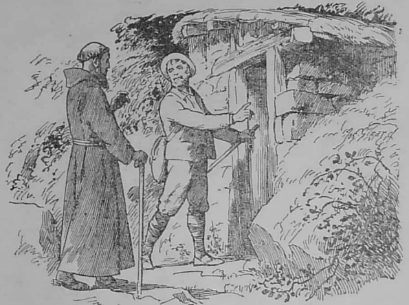
Setu-ni dirak lochenn ar forban...

— Siouaz ! an archerien ha va enebourien a zo war evez ; ma vezomp gwelet asamblez, e vo kavet repu va niz. Deut kentoc'h warc'hoaz, war-dro 9 eur war lez ar c'hoad, me a vo eno. »