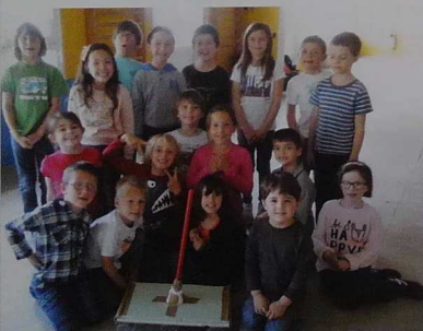
La classe de cp/cel et son objet de défi techno en cours de réalisation