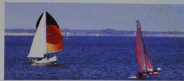
Un flying phantom croisant la route de Pen Duick V devant l'École Nationale de Voile et des Sports Nautiques

L'École Nationale de Voile et des Sports Nautiques connaît, durant l'été, sa période d'apogée. Cette année, les événements accueillis par l'ENSVN ne manqueront pas. Ceux-ci promettent un été dynamique à tous : La Semaine Affolante réunira, les 12, 13 et 14 juin, de nombreux engins à foils. Du 4 au 9 juillet, les Championnats de France Minimes rassembleront plus de 400 jeunes venus de l'ensemble du territoire. Ensuite, le Championnat de France Finn aura lieu