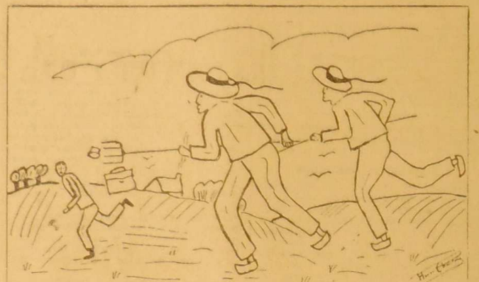
Comment l'un de nos très jeunes lecteurs a vu un Contrôleur du Ravitaillement en « tournée » dans le Finistère

Aussi ne saurions-nous trop recommander la prudence à nos compatriotes.