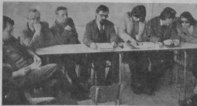
Conférence de presse du C.S.P.I. à Brest le 15 mars 1972

A l'initiative de l'U.D.B., un Comité de Solidarité au Peuple Irlandais (C.S.P.I.) a été créé. Une conférence de presse s'est tenue le 15 mars 1972 à Brest pour annoncer la création de ce Comité dans les termes qui suivent :