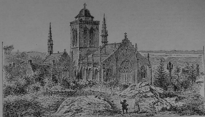
Iliz Lok-Ronan ( )