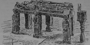
Bez Sant Ronan

zisehlavi skeudenn sant Ronan; ac'hano e vez prezeget — eur gwir brezegenn war ar menez, hounnez ivez, — ha pa vez diskuzet eun tammig an dud, ha faolet eur zell war ar vro gae a weler ac'hano tro-war-dro, e tiskenner warnu Plogoneg, e tremener ebet ouz guez c'hlas , ha bez Kebeu-merket gant eur groaz koz ha ne vez ket saludet, hag eur wech treuzet lammeier Gorrekêr, oc'h en em gaver en dizro, er voure'h, evit kana an Te Deum e chapel ar Peniti.