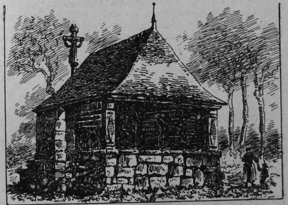
Ti-bedi sant Kadou, e Gouesnac'h

Evit diskar eun dra n'eus ket a labour pell: tennoc'h eo hen adsevel ha ne vezer ket sur atao da zont a-benn d'hen ober! G. P.