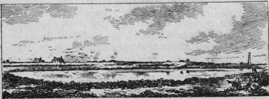
Len al Loc'h e Glenan

Peder leo diouz an douar bras, eün hag eün d'an aber a zo e kreiz etre beg Lok-Tudy ha beg Trevignon hag e kouez ennan dour ster goant an Odet, ema enezeier Glenan: nao o zo anezo, met war an nao n'eus nemet c'houec'h hag o defe talvoudegez: an Dreñeg, ar Gioteg, al Loc'h, Kigneneg, Sant Nikolas hag ar Penfred; an teir all n'int nemet reier bras ha ne vev warno nemet morveot ha brini-mor.