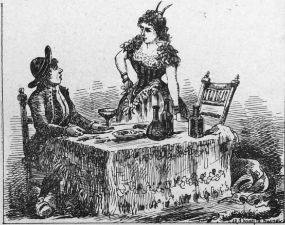
Gwrac'h al Loc'h o touelli eur paotr yaouank

wrac'h, war he meno, a oa prest da zimezi gant pep hini anezo, met, pa veze skuiz gand unan hen troe e pesk, her stlape en eur vagerez hag her roe da zebri d'he gwaz nevez a vije graet d'ezan ar pezh a veze bet graet d'ar re all a oa bet en e raok.