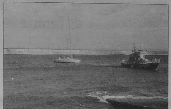
Le Rapido Select, remorqué par le Ville de Paris arrive à la cale du port de Sein

Référence Sein. Prédications calculées par le service hydrographique et océanographique de la marine et reproduites avec son autorisation n° 62293.