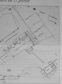
Déchetterie de l'île

Un concours ouvert aux enfants de l'école de l'Île d'Aix, est organisé sous le patronage de l'Écho des Îles.