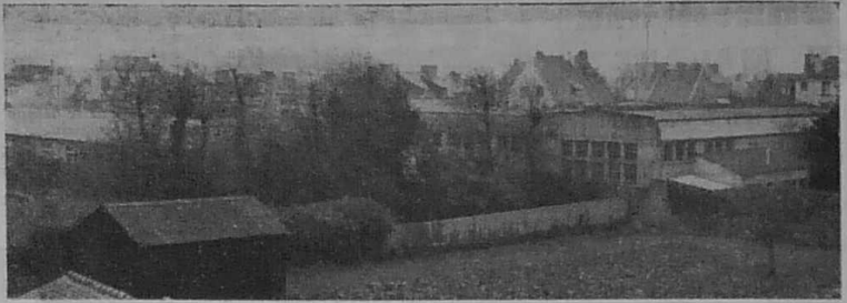
Un ensemble de bâtiments qui font rêver bien des travailleurs.

Une usine de Paramé attend depuis onze ans que l'on daigne donner le signal de mise en marche