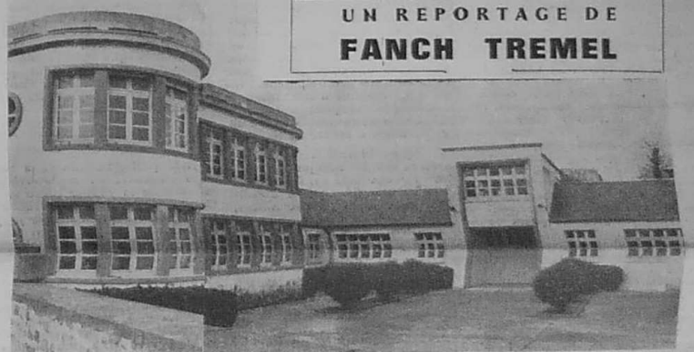
Une usine moderne et rationnelle attend qu'on veuille bien l'utiliser.

prête à ouvrir ses portes, direz-vous ; elle n'attend que... » Que quoi, au juste ? Cela fait, tenez-vous bien, onze ans et demi que cette usine de fabrication d'appareils téléphoniques Le Lass est construite. C'est le château de la Belle au bois dormant. Tout attend depuis plus de onze ans le coup de baguette d'une bonne fée qui donnera vie enfin à ces locaux : les