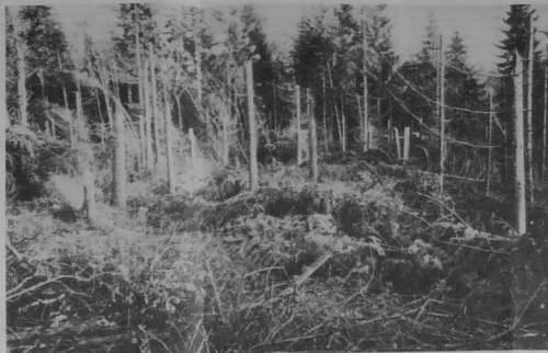
Dans le bois de Pommerit-le-Vicomte, les arbres coupés en deux.