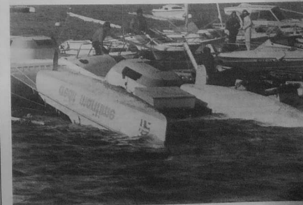
Le port de plaisance à Concarneau, le 16 octobre au matin.