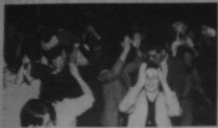
Jeune Amicale, le 13 décembre à Bobigny.

Le banquet de la Jeune Amicale de Bobigny, qui s'est tenu le 13 décembre, a réuni près de 300 personnes. Les convives ont apprécié le repas copieux et les discours prononcés par les dirigeants de la Jeune Amicale. L'ambiance était très agréable et les échanges ont été très intéressants. Le banquet a été organisé par les soins de la Jeune Amicale et a permis de renforcer les liens entre les membres de la société.