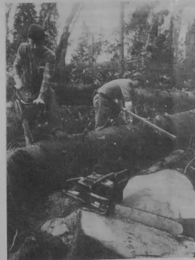
Les bûcherons à l'œuvre, fin novembre, dans la forêt de cinquante hectares du manoir de Roscvel, à côté de Quimper, détruite à 90 %. Des centaines de chênes centenaires ont été anéantis.