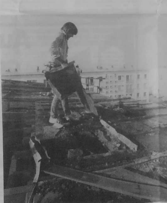
La toiture d'un bâtiment H.L.M. de Kéraudon, à Concarneau, un mois après la tempête.