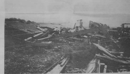
Ce qu'il reste de l'élevage de 7 500 dindes de M. et Mme Pastol, au Derff en Grâce, près de Guingamp.