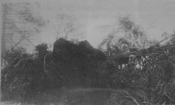
Imaginez la puissance nécessaire pour arracher pareille souche (manoir de Roscvel, à proximité de Quimper).

La question de l'indemnisation et de l'aide publique pose de nombreux problèmes. La solidarité est à l'ordre du jour.