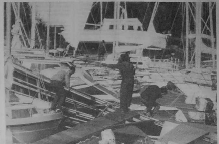
Le port de Sainte-Marine à Bénodet.

Il est lourd. Très lourd. Le bilan de la tempête qui a ravagé la Bretagne cette fameuse nuit du 15 au 16 octobre... Le chiffre de 10 milliards de dégâts a été avancé. 4 milliards rien que pour le département des Côtes-du-Nord ou les pertes agricoles seules sont estimées à plus de 700 millions de francs. Dans le Morbihan, le chiffre des dégâts approche 2,5 milliards. 2 milliards dans le Finistère. Un quart de la forêt bretonne est détruite. Le département des Côtes-du-Nord est, là aussi, le plus touché (1 milliard de francs).