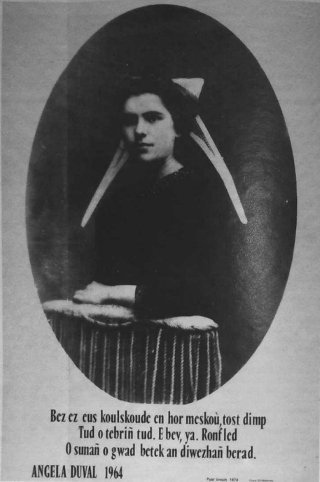
Bez ez eus koulskoude en hor meskoù tost dimp Tud o tebrin tud. E bev, ya. Ronfled O sunañ o gwad betek an diwezhañ berad.

An aessañ, ewid ober anaoudegezh gant Añjela Duval, e oa mont di war ar pemdez, diouz ar gouañ, pa vez fall an amzer ha bered ar deiz. Neuse he devese Añjela muloc'hig a amzer da ouestlañ d'he gweladennierien, hag i skolveuridi. Dreistoll pa wele Añjel he devese afer gant brezhonegerien, he skuitze ket, chom a rae da gontañ,