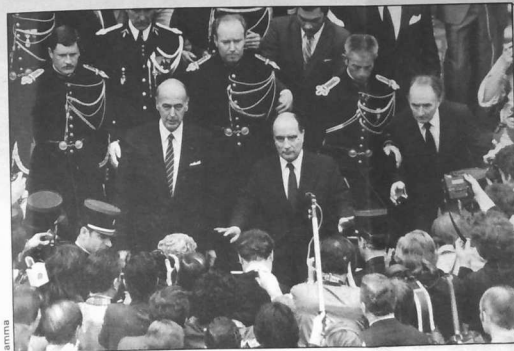
Daou bresidant : an heni kozh hag an heni newez ; an heni a weler war an tu dehoù zo deus an tu kleiz, hag an heni a weler war an tu kleiz zo deus an tu dehoù...