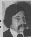
P. PELLEN NAONED 2

15 kandidad eus an UDB e vont war ar renk, un tamm peb lec'h e Breizh, Bro-Naoned hag all eveljust. Bez' eus an UDB bremañ e-barzh ar majorite nevez, hag e sko war an tu kleiz gwelloc'h eged biskoazh, mes war an tu kleiz breizheg. Goulenn a ray kandidated an UDB, fraezh, an emrenerezh sokialour ewid Breizh. Bez' e c'hell an emrenerezh-se bezañ tizhet pasenn-ha-pasenn eveljust, med red eo diskouez ar dal, heb chom da doriañ. Ar Vretoned emskianteg, kar-o-bro, kar-ar-justiss, kar-ar-brezhoneg, hag all, hag all, eus o dever votih o ewid an UDB ha lakaad an dud da votih ewiti. Kemromp eta penn an hent : poent eo.