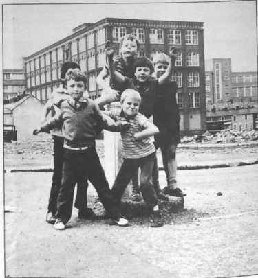
Bugale katolik en Ulster