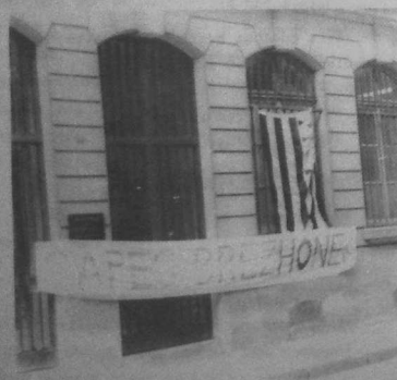
ar ministrerezh : breizhat ha brezhonek evit un endervezh.

Beureik an deiz-se, e loc'has eus Roazhon ur c'harr-boutin, e bal = PANIZ (Pariz a zo kêrbenn ar vro a zalc'h hon bro abaoe re a vloavezhioù dija) ; pal ar c'harrad-boutin (war-dro daou - ugent den, holl studieren war ar brezhoneg e skol-veur Roazhon) : mont da aloubiñ Ministrerezh an Deskadurezh ar vro-se, ya, e lec'h ma vez dibabet ha divizet petra zo mat ha petra zo fall evit bugale geizh hon C'hornaoueg kollet. Ya, ar vakañsoù oa ivez ha keit ha ma vez tud o skiañ pe o tiskuiñ, e vez kavet c'hoazh un nebeud tud prest c'hoazh da stourm evit gouenn (hag adc'houlenn) ur c'hcapes brezhonek.