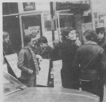
e Straed ar Sirk : ur farouell o lakaat ar Vrezhoned da c'hoarzhin leun o c'horf

tiwall dor pennrener ar Republik. Bepred ken diaviz, emañ ar Vretoned bremañ o klask dibunañ : gwa dezhe ! Eüruzamant e c'honez al lezenn hag an urzh ha setu ar ganfarded-mañ kaset da Straed ar Sirk, dre chañs ez eus aze ivez un nebeud farouelled (bepred ar re gwisket e glas teñval) o lakaat an dud da c'hoarzhin.