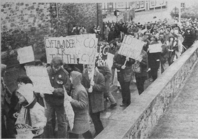
SK. Y CYMRO

sindikad savet gant ar studieren gembraek o-unan (U.M.C.B.).